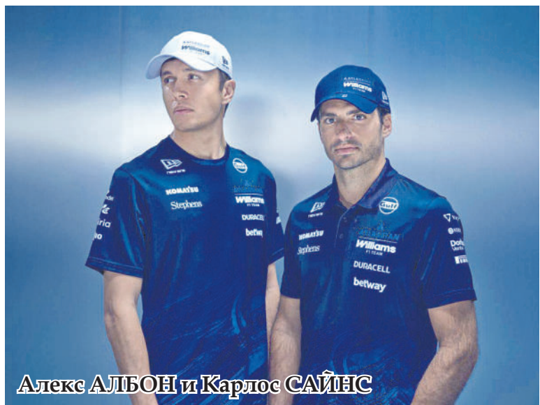
Алекс АЛБОН и Карлос САЙНС